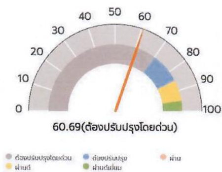
ผลการประเมินในภาพรวม