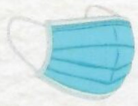
สวมหน้ากากอนามัยที่ได้มาตรฐาน