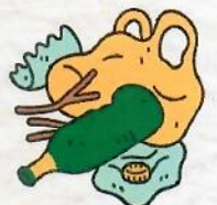
ไม่เผาขยะ เเผาป่า หรือพืชผลทางการเกษตร