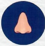
แสบจมูก ไอ มีเสมหะ