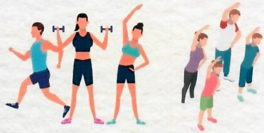
เลี่ยงกิจกรรมกลางแจ้ง ในช่วงที่มีฝุ่นเกินมาตรฐาน