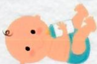
เด็กเล็ก