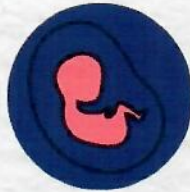
ทารกแรกเกิด มีน้ำหนักน้อยกว่าปกติ