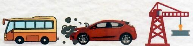
เลี่ยงพื้นที่เสี่ยงฝุ่นควันมาก เช่น ริมถนน เขตก่อสร้าง