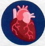
โรคหลอดเลือด หลอดเลือดสมอง หัวใจขาดเลือด