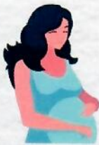
หญิงตั้งครรภ์