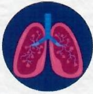
มะเร็งปอด