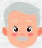
ผู้สูงอายุ