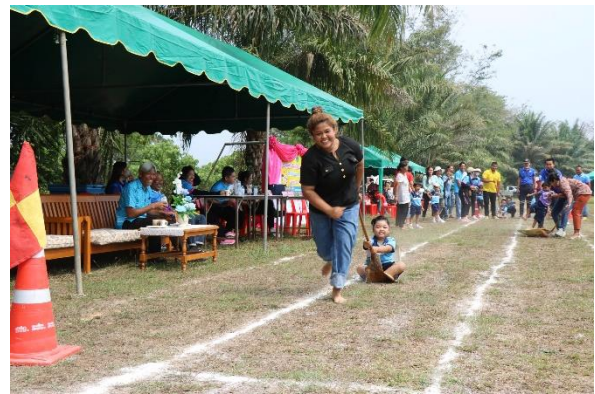
คณะผู้บริหาร และสมาชิก อบต.