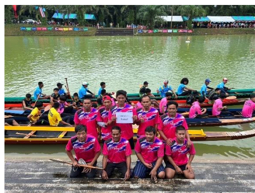
เรือสิงห์เผ่า