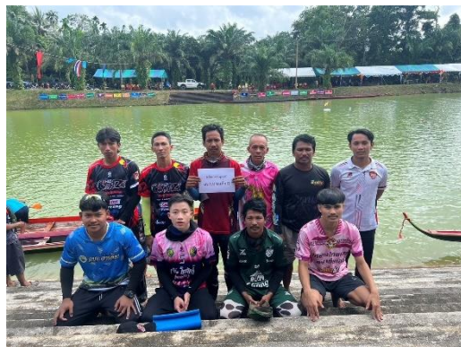
เรือ อบต.บางแก้ว B