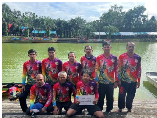
เรือพรหลวงพ่อสินธุ์ ๑