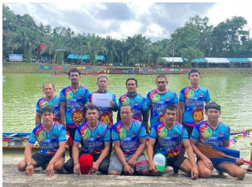
เรือพรพ้อเพชร