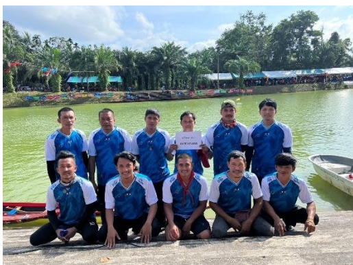
เรือเพชรพรเทพ