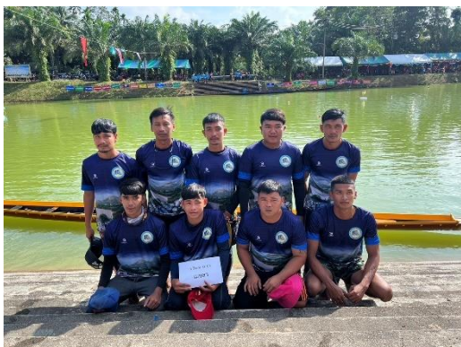
เรือเมขลา