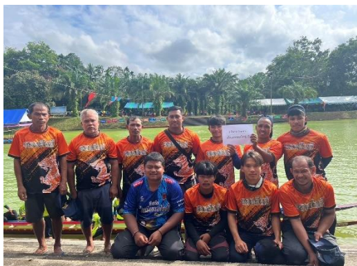
เรือเจ้าแม่หนองใหญ่ ๒