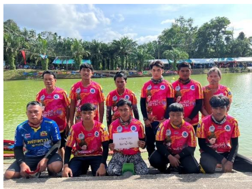
เรือธิดาน้ำจืด