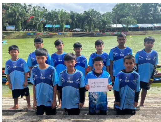
เรือขงเบ้ง APF ONE