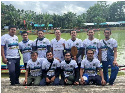
เรือลูกเข้พานไค้ง