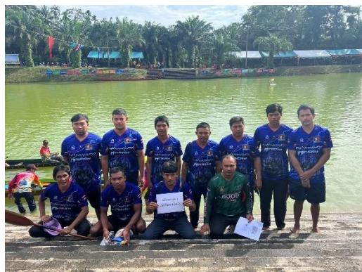
เรือภัทรชัยเพชรน้ำหนึ่ง