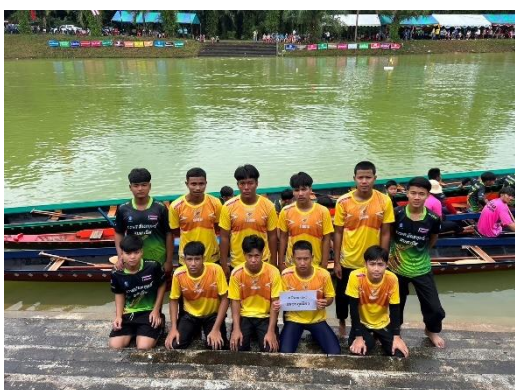
เรือเพชรคูเมือง