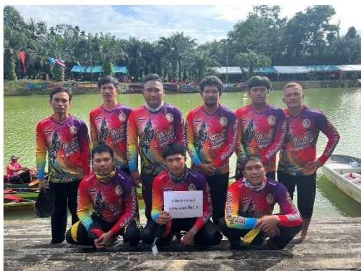
เรือพรหลวงพ่อสินธุ์ ๒