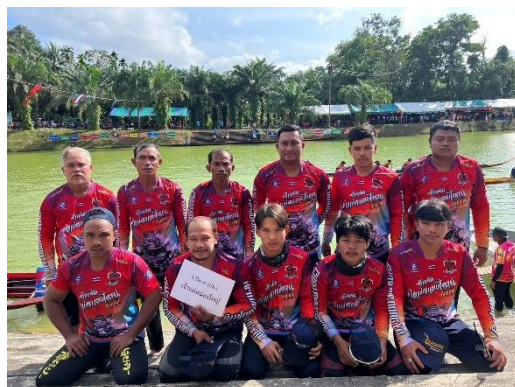
เรือเจ้าแม่หนองใหญ่