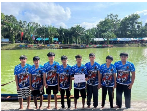
เรือเพชรคูเมือง