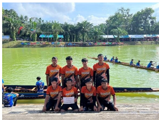
เรือชมรมเรือพายจังหวัดระนอง