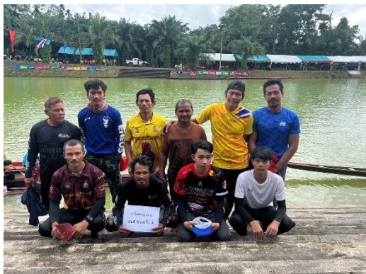
เรือ อบต.บางแก้ว A