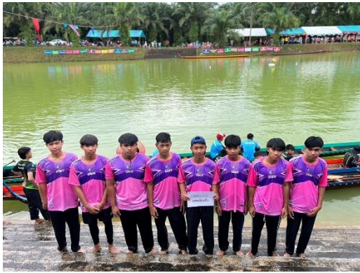
เรือเทพบัณจัต