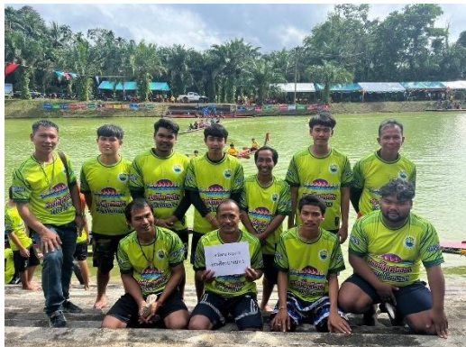
เรือเทพธิดาบางนา ๑