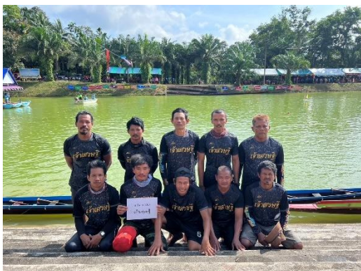
เรือเจ้าเศรษฐี