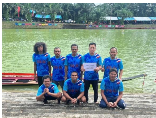
เรือเพชรคูเมือง