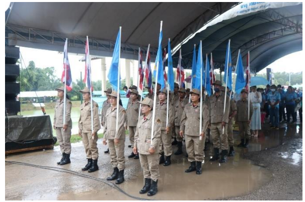
หัวหน้าส่วนราชการ, ผู้นำท้องที่ , ผู้นำท้องถิ่น