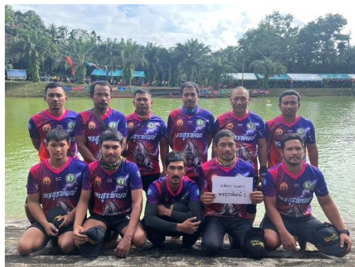
เรือพรสุรพัฒน์ ๑