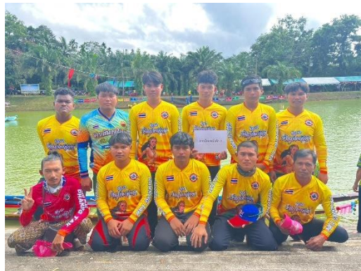
เรือสาวน้อยพนักัดก ๒