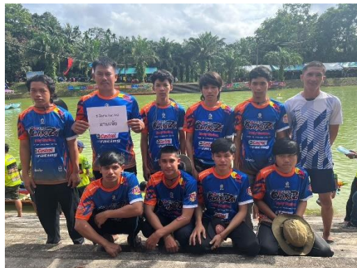
เรือมานะชัย