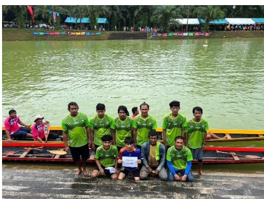
เรือมานะชัย