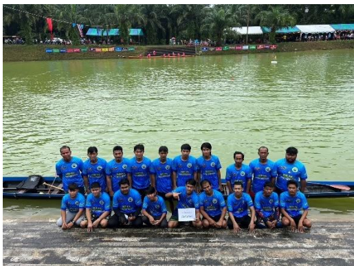
เรือสไบทิพย์