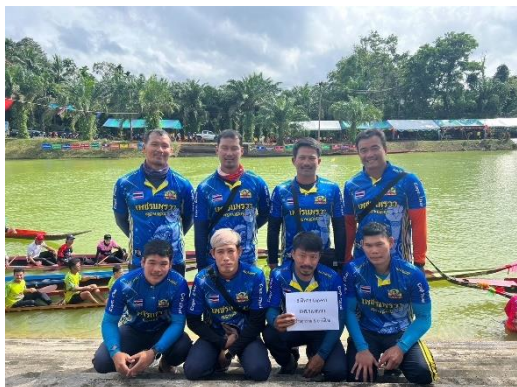
เรือเพชรแพรวา บ้านสุวรรณ & ปาร์ตี้โฮม