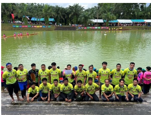
เรือบ้านสุวรรณ & ปาร์ตี้โฮม