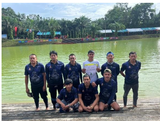
เรือหลวงจันทรภักดี