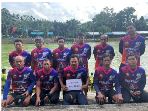
เรือพรสุรพัฒน์ ๒