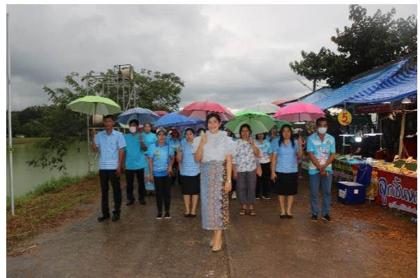
ประชาชนตำบลปากจั่นจำนวน ๑๑ หมู่บ้าน และประชาชนทั่วไป