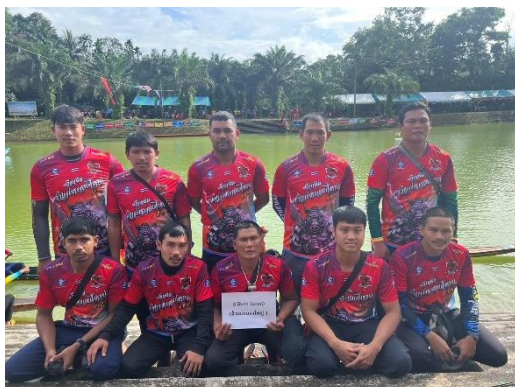
เรือเจ้าแม่หนองใหญ่ ๑