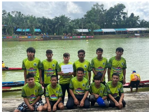
เรือเทพธิดาบางนา ๒