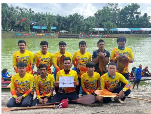
เรือหนุ่มทองแดง